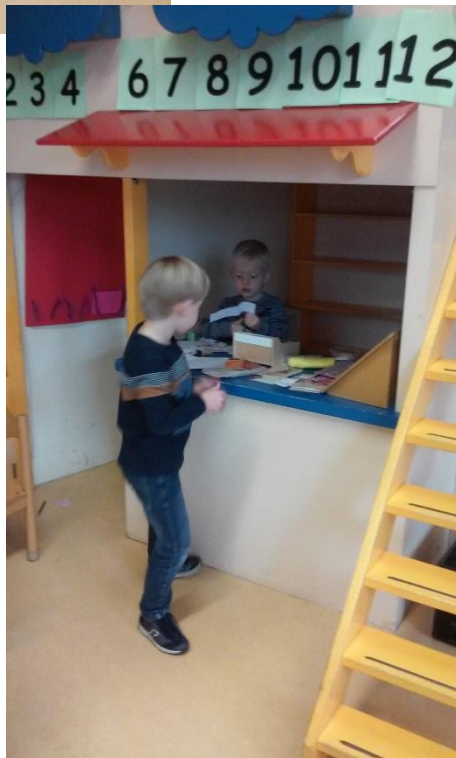
Thommas en Ties zijn druk bezig in het postkantoor.