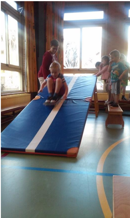
Hier hebben we een skate-baan neergezet die elke dag een beetje hoger gaat. Dit is de laatste dag waarbij de baan op zijn hoogst staat. Met de billen op het skatebord naar beneden rijden. En de hele klas durft dit!

Aan het einde van de speel-/werktijd ruimen de kinderen weer alles zelf op. Na het gezamenlijke eten en drinken worden de gymtassen uitgedeeld voor de gymles. Ons klassenrecord met omkleden staat op 6! minuten.