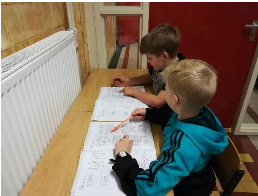
Samen werken kunnen wij ook!