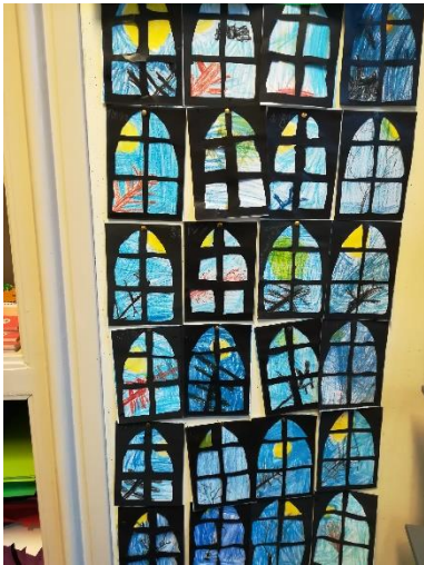
Tekening tijdens de kinderboekenweek

In de klas doen wij natuurlijk ook andere dingen. Zo kennen wij een heel leuk lied als er iemand jarig is en kunnen wij erg mooie knutselwerkjes maken. Tijdens de lessen zijn wij niet alleen maar bezig met zelfstandig werken. Wij doen ook coöperatieve spelletjes. Af en toe werken wij ook samen en helpen wij elkaar.