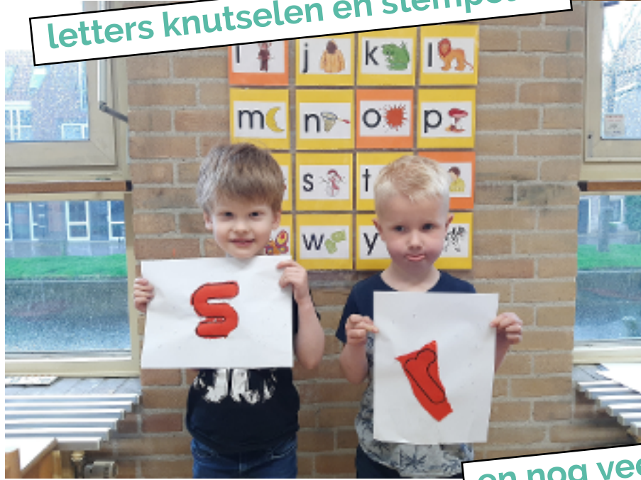
en nog veel meer....!