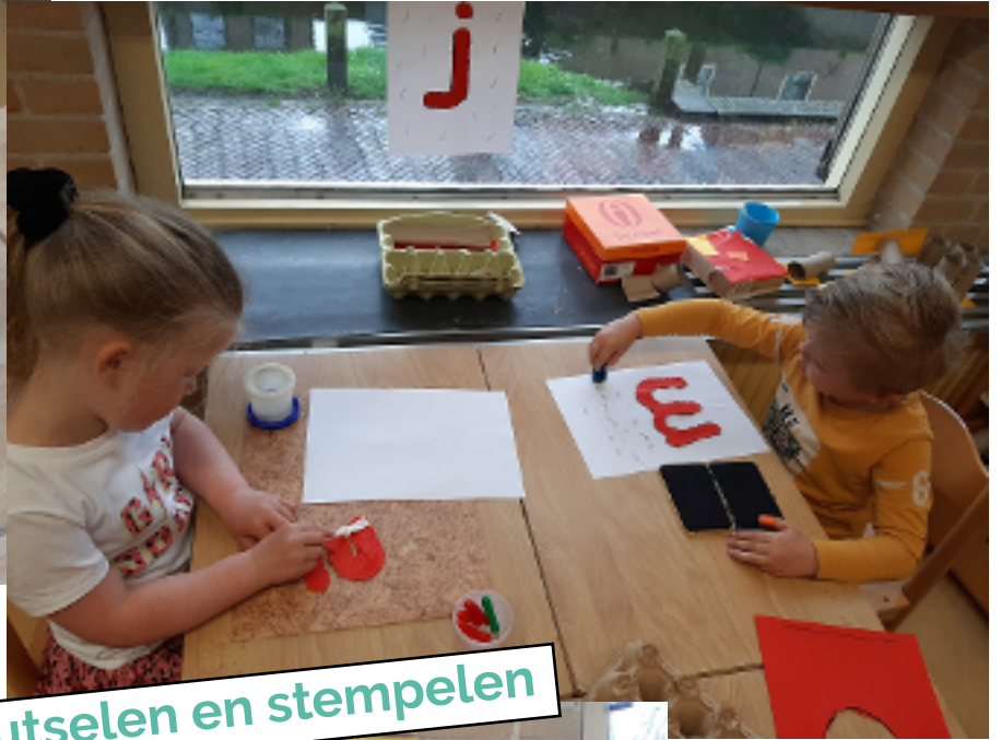
letters knutselen en stempelen