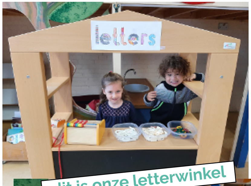
dit is onze letterwinkel