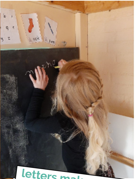
letters maken op ons nieuwe krijtbord