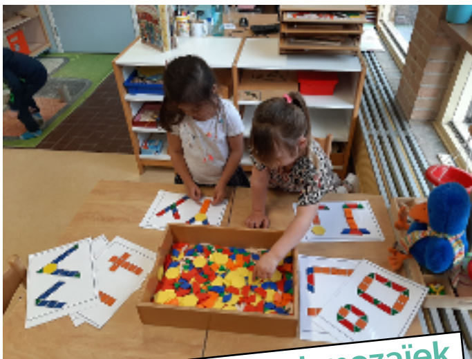
letters maken met mozaïek

Naast het letterwinkeltje doen we nog veel meer met letters!