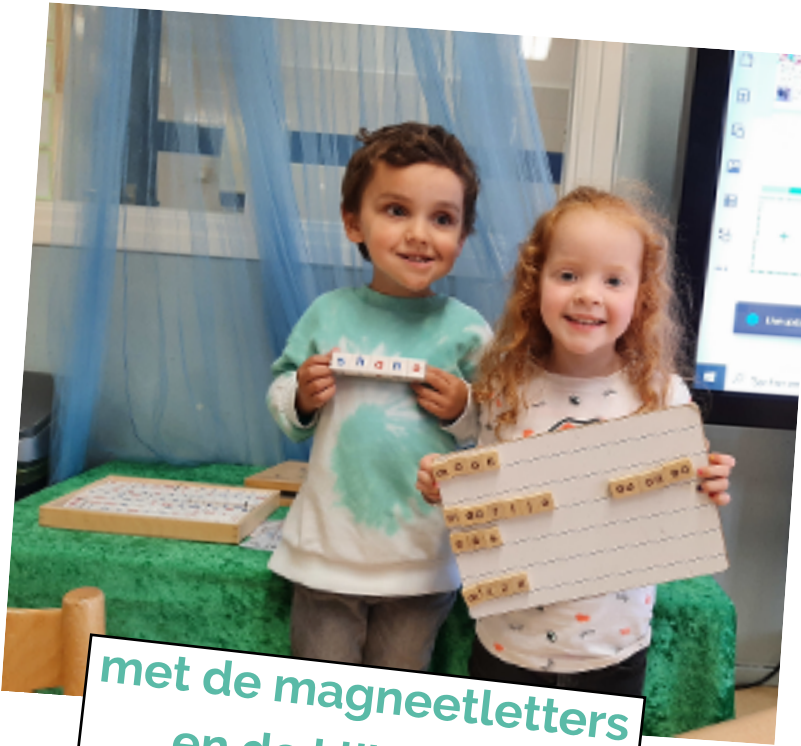
met de magneetletters en de klikletters