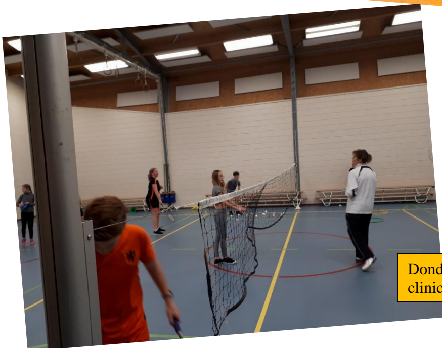
Donderdag 19 januari: Badminton- clinic door Rackmind