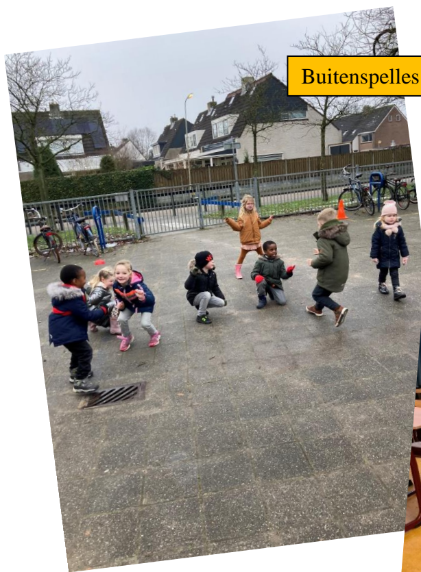
Buitenspelles op de vrijdagmiddag