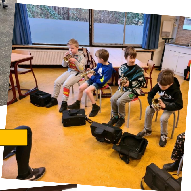
Trompetles groep 5