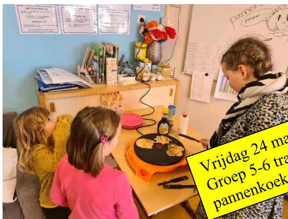
Vrijdag 24 maart was Pannenkoekendag. Groep 5-6 trakteerde de hele school op pannenkoeken.