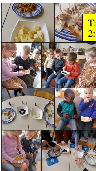
Thema “Holland”: proeverijtje in groep 1-2: kaas, drop, haring, stroopwafels

(En Demanyana uit de vorige kalender heet toch echt Demyana; En juf Lotte was ook nog jarig: 28 maart)