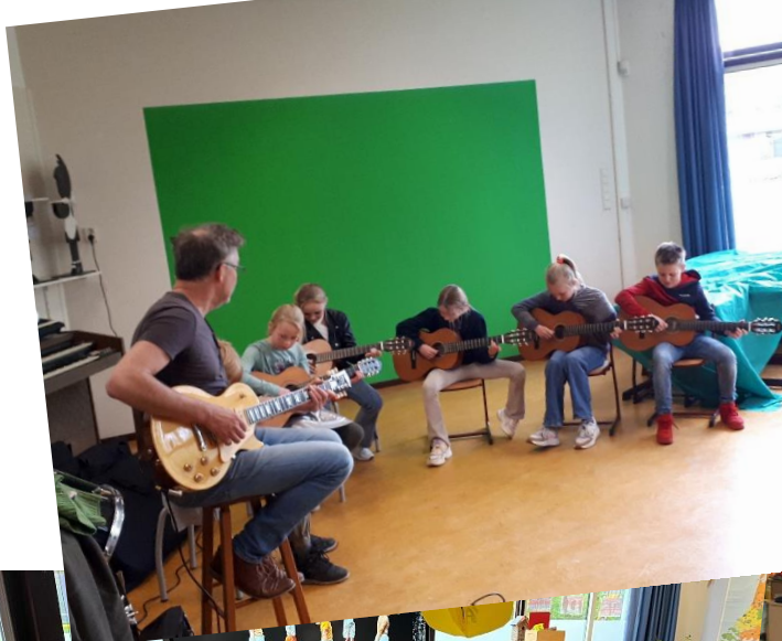
Laatste gitaarles groep 7 met presentatie voor ouders.