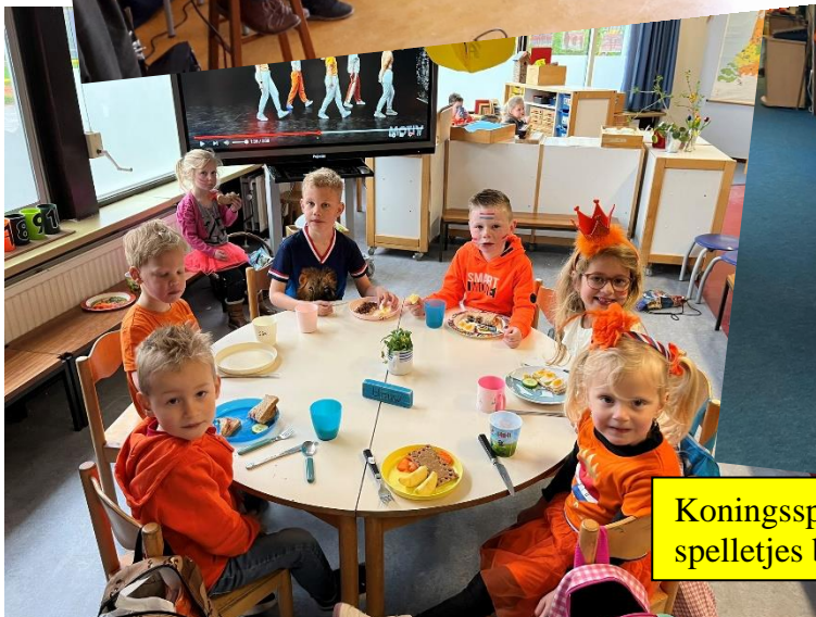
Koningsspelen met ontbijt in de klas en spelletjes binnen.