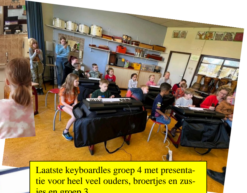
Laatste keyboardles groep 4 met presentatie voor heel veel ouders, broertjes en zussen en groep 3.