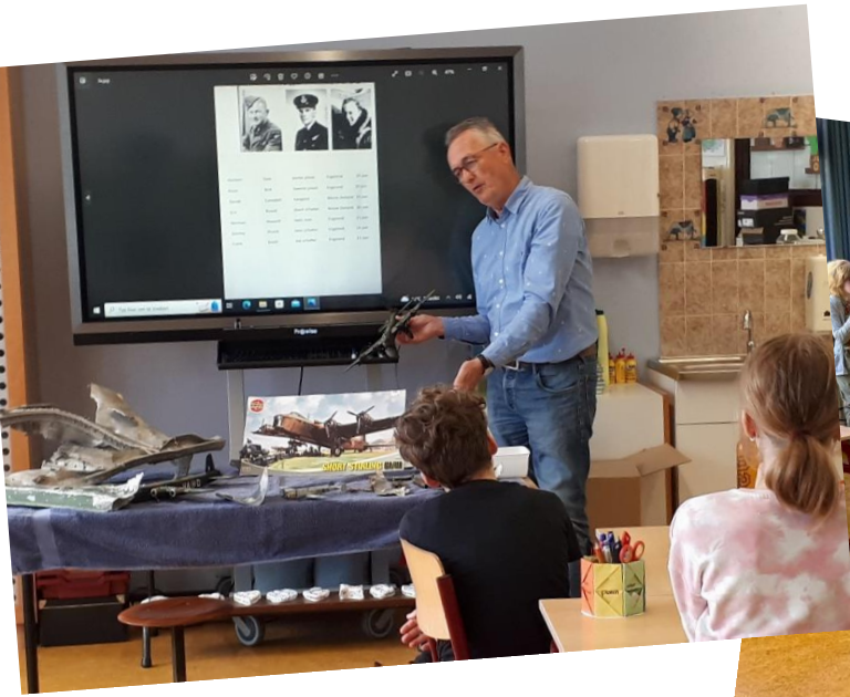
Gastles Jan Houter over de Short Stirling en het monument aan de A.C. de Graafweg