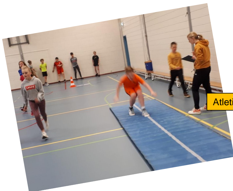
Atletiekochtend groep 5-6 en 7-8