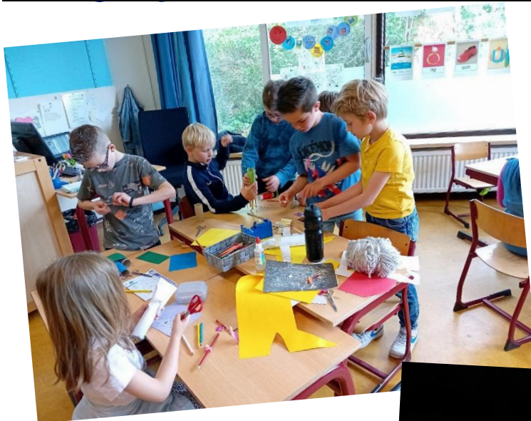
Groep 3-4 werkt aan het thema 'Planeten'