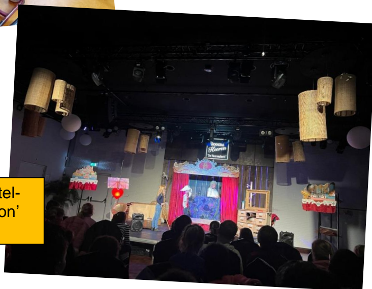
Groep 5-6 bezoekt de voorstelling 'De Baron die alles verzor' in de Hooghe Heeren